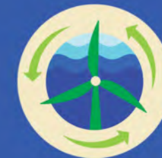
CADEIA DE VALOR POSITIVA