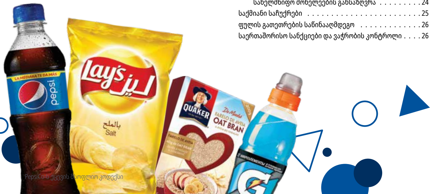
PepsiCo-ს ქცევის მთავლი კოდექსი