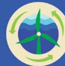
დადებითი ფასეულობათა ჯაჭვი