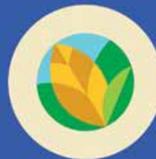
დადებითი სოფლის მეურნეობა