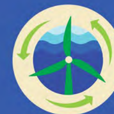
CADEIA DE VALOR POSITIVA