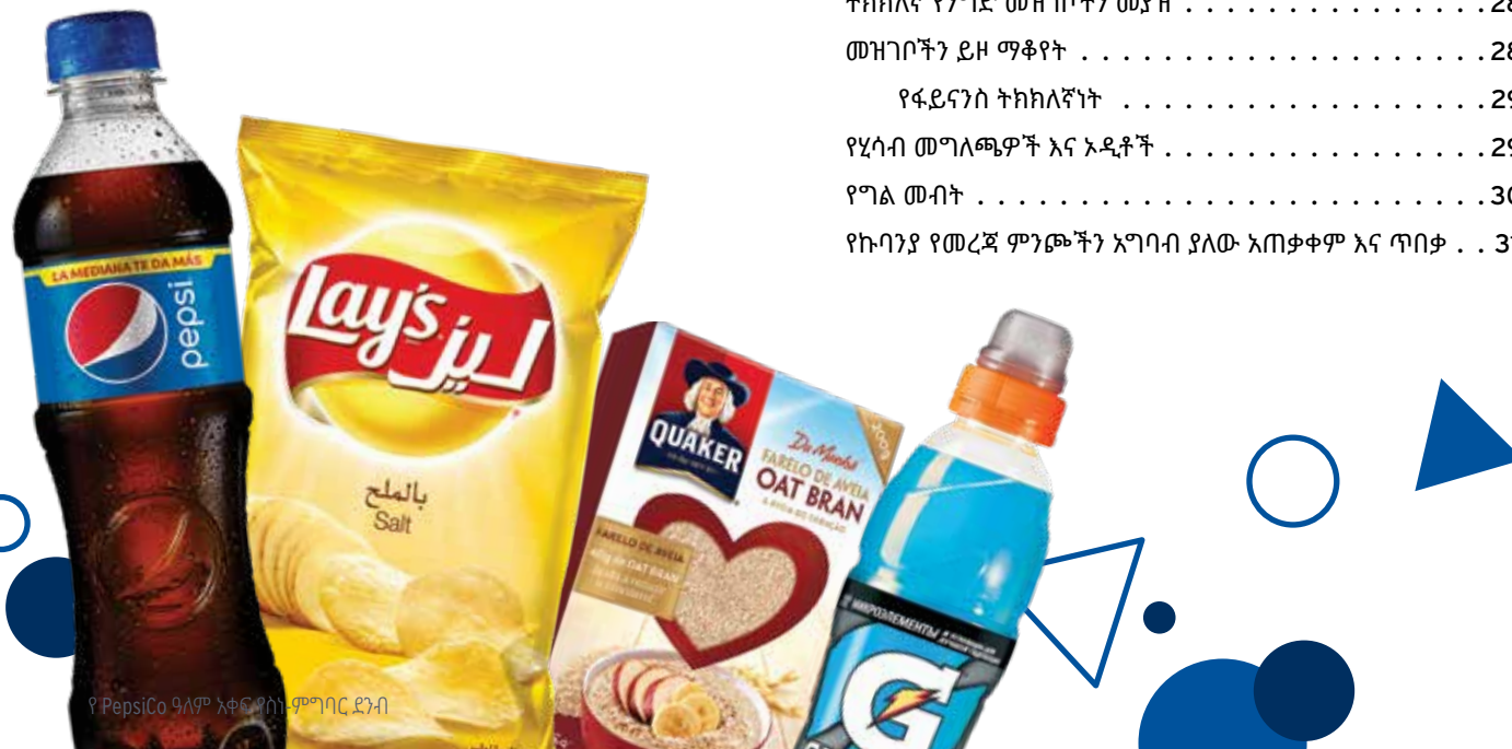
የ PepsiCo ዓለም አቀፍ የስነ-ምግባር ደንብ